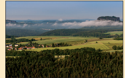
Ausblick vom Fritzschenstein

Vom Ort Waltersdorf geht es entlang der Neuporschdorfer Straße bis zum Abzweig auf der linken Seite. Auf einem Feldweg führt die Wanderung zum Bockstein. Von hier aus lohnt sich ein Abstecher zum Fritzschenstein. Mit schönem Blick auf die Felswände von Brand und Ochel wandert man zum Ort Porschdorf.