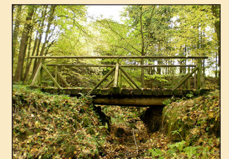
Holzbrücke im Prossener Gründel

Vom Elberadweg in Prossen wandert man an einer alten Parkanlage vorbei in das Prossener Gründel. Im idyllischen Talgrund führt der Wanderweg zum Ort Waltersdorf.