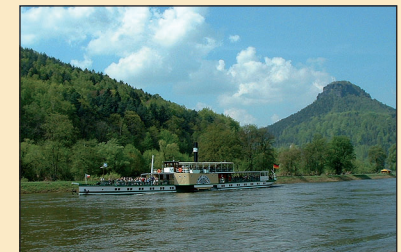
Historischer Raddampfer auf der Elbe

Über das Bergersteigl und den Ringweg von Porschdorf gelangt man auf die Felder mit Weitblick auf die großen Tafelberge der Sächsischen Schweiz. Durch den ehemaligen Weinberg geht es mit wunderschöner Aussicht auf das Elbtal und den Lilienstein hinunter in den Ort Prossen und an die Elbe.